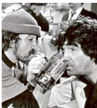
> De los clásicos que tiene en cine se encuentra "La Pulquería".