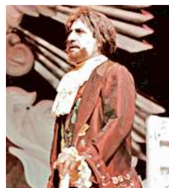
> "El Avaro" es de las obras más importantes en su carrera.