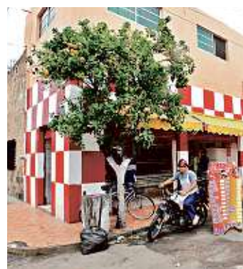
> En los 50, la carnicería se llamaba "La Higiénica".